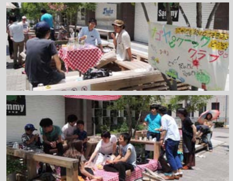
第2回ピクニックの様子

この『東京ピクニッククラブ』に感化された名古屋居住のメンバーが、『ナゴヤピクニッククラブ』を結成。これまでに2回活動をおこない、今回が3回目の開催となる。